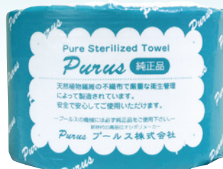
DTR-65 50m 巻 (50g/m 2 ) 1ケース/24入