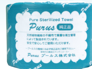
DTR-400 20m 巻 (120g/m 2 ) 1ケース/24入