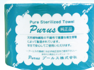
DTR-300 30m 巻 (80g/m 2 ) 1ケース/24入